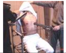
酷刑—电棍电示意图

讯逼供，用几万伏的电棍在他身上到处乱电，几乎电遍了他全身的每一处地方，经常是把电棍捅在他身上，直到电力耗尽，然后换一把接着电。就这样，三把电棍轮番充电，换着电。还用警棍击打他的头部，甚至把警棍都打弯了。有时候恶警还用肘部击打他的头，跳起来往下砸。他的爱人也被迫流离失所，至今仍有家不能回，无法联系。