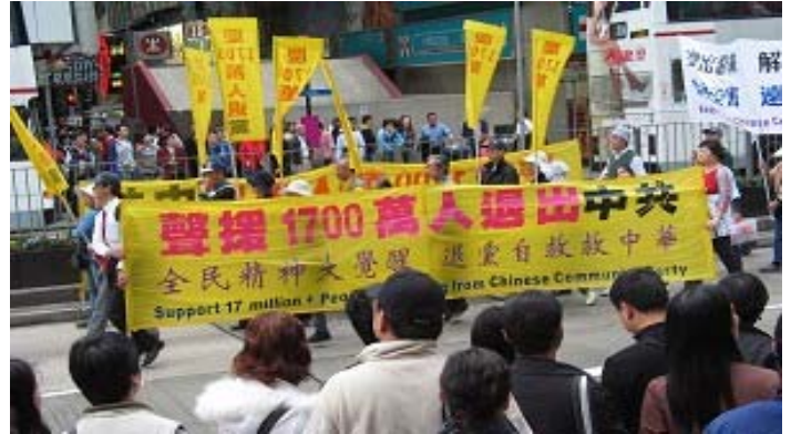
香港元旦游行声援 1700 万退出中共恶党、团、队

《九评共产党》一书深刻揭露了中共邪恶本质，已在中国促成强大的退出中共恶党的大潮，到 2007 年 1 月 3 日已有超过 1700 万中国民众在海外大纪元网站声明退出中共党、团、队。其中包括中共党政军高层内的党员。