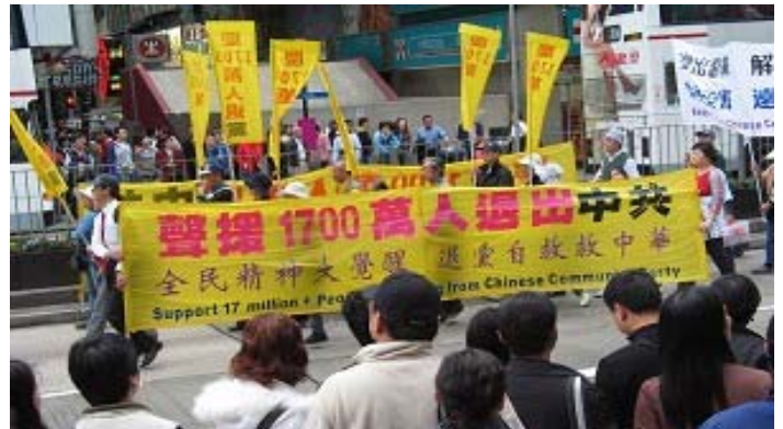
香港元旦游行声援 1700 万退出中共恶党、团、队

《九评共产党》一书深刻揭露了中共邪恶本质，已在中国促成强大的退出中共恶党的大潮，到 2007 年 1 月 3 日已有超过 1700 万中国民众在海外大纪元网站声明退出中共党、团、队。其中包括中共党政军高层内的党员。