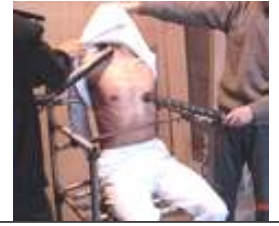
酷刑—电棍电示意图

讯逼供，用几万伏的电棍在他身上到处乱电，几乎电遍了他全身的每一处地方，经常是把电棍捅在他身上，直到电力耗尽，然后换一把接着电。就这样，三把电棍轮番充电，换着电。还用警棍击打他的头部，甚至把警棍都打弯了。有时候恶警还用肘部击打他的头，跳起来往下砸。他的爱人也被迫流离失所，至今仍有家不能回，无法联系。