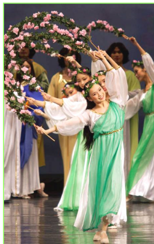
舞蹈《誓约》。慈悲的神立誓下世救人，并为人类有得救的机会而欢庆。

【明慧网】由新唐人电视台主办的全球华人新年晚会，于零七年一月五日至七日，在著名的旧金山歌剧院连演三场，约九千两百位中西方观众欣赏了这场展现中华神传文化神韵的辉煌演出，观众为之震撼、激动。