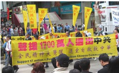
▲香港游行声援一千七百万中国民众退出中共恶党、团、队

由于我们都是第一次来，真有点吃惊。有的职工问我：“院长，可以接资料吗？”我说：“别人都接，我们就接吧。”又问：“可以看吗？”我说：“既能接、就能看。”