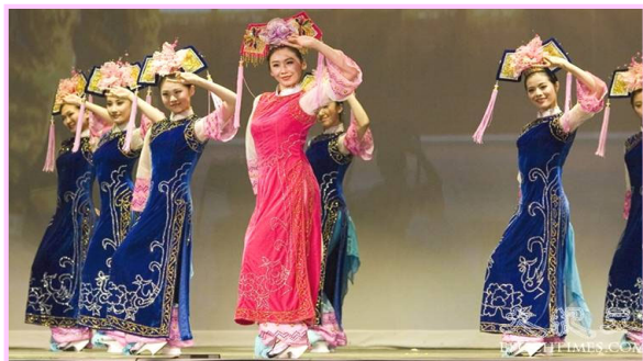
清盛时传统女性服饰 《满族舞》展示了满族传统女性服饰

【明慧网】由新唐人电视台主办，旨在弘扬中国传统文化的第四届“新唐人全球华人新年晚会”将在世界近三十个大城市上演六十多场。