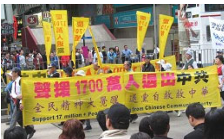
▲香港游行声援一千七百万中国民众退出中共恶党、团、队

由于我们都是第一次来，真有点吃惊。有的职工问我：“院长，可以接资料吗？”我说：“别人都接，我们就接吧。”又问：“可以看吗？”我说：“既能接、就能看。”