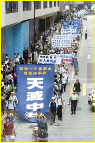
▲“天灭中共”大横幅在香港九龙闹市区

我一听此话有些不对劲，因为我小叔子就是炼法轮功的，我了解他们都是冒着被抓、被打、被判刑、甚至生命危