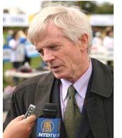
加拿大调查员乔高

【明慧网二零零七年一月十一日】（明慧记者英梓报道）近日，加拿大独立调查员大卫·乔高在渥太华接受媒体采访时表示，在游历三十个国家的首都过程中，已经获得了新的证据证明中共活体摘取法轮功学员器官（下简称：活摘器官）指控的真实性。乔高并表示将最新获得的八至九条新证据加入调查报告，并发表报告的修订本。