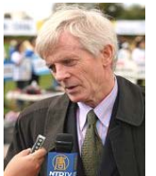
加拿大调查员乔高

【明慧网二零零七年一月十一日】（明慧记者英梓报道）近日，加拿大独立调查员大卫·乔高在渥太华接受媒体采访时表示，在游历三十个国家的首都过程中，已经获得了新的证据证明中共活体摘取法轮功学员器官（下简称：活摘器官）指控的真实性。乔高并表示将最新获得的八至九条新证据加入调查报告，并发表报告的修订本。