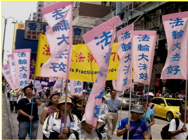
▲香港“法轮大法好”彩旗飘扬

【明慧网】我是一家医院的负责人，十月份本院一行十几人去香港旅游几日。来到香港真是大开眼界，这里完全是另外一个世界。法轮功在这里是公开合法的。每到一处都有法轮功修炼人给我们讲真相发传单、送光盘等。特别是海洋公园太热闹了，其中有一段路程约七、八十米两边