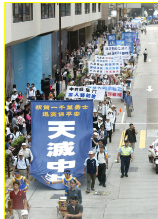
▲“天灭中共”大幡在香港九龙闹市区

我一听此话有些不对劲，因为我小叔子就是炼法轮功的，我了解他们都是冒着被抓、被打、被判刑、甚至生命危险在救人，资料是他们省吃俭用的钱来做的。到哪儿去领工资呢？于是我对那个中国导游说：“那他们一个月领多少钱？”那个导游的脸刷一下红了，说：“快走！赶上队伍。”随