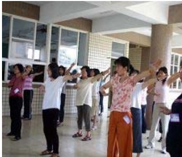
台湾教师参加研习学炼功法

【明慧网】近年来，台湾许多县市都在寒暑假举办“法轮功教师研习营”，由各行各业学有专精的法轮功学员，向中小学的教职员介绍法轮功。这项活动使很多教育工作者将自己在修炼中领悟到的“真、善、忍”法理溶入日常教学中，广受县市政府教育局、校长、教师们欢迎。各大专院校的四十多