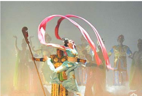
《飞天》：传说中天国世界的飞天纯净美丽，在天际间飞舞，来去自如，令人向往。

【明慧网】全球瞩目的新唐人电视台举办的首届九场系列“圣诞晚会”于二零零六年十二月十