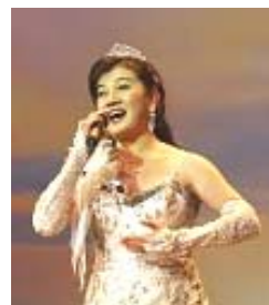
女高音歌唱家白雪

女高音歌唱家白雪演唱的《找真相》歌词有诗意，歌中唱道： 天地两茫茫，世人向何方， 迷中不知路，指南有真相； 贫富都一样，大难无处藏， 网开有一面，快快找真相。 甜美的歌声把看到光明的力量送 向观众，赢得全场掌声如潮。