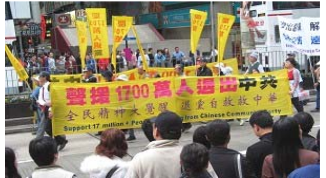
香港元旦游行声援1700万退出中共恶党、团、队

《九评共产党》一书深刻揭露了中共邪恶本质，已在中国促成强大的退出中共恶党的大潮，到2007年1月3日已有超过1700万中国民众在海外大纪元网站声明退出中共党、团、队。其中包括中共党政军高层内的党员。