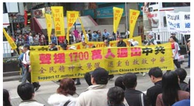
香港元旦游行声援1700万退出中共恶党、团、队

《九评共产党》一书深刻揭露了中共邪恶本质，已在中国促成强大的退出中共恶党的大潮，到2007年1月3日已有超过1700万中国民众在海外大纪元网站声明退出中共党、团、队。其中包括中共党政军高层内的党员。