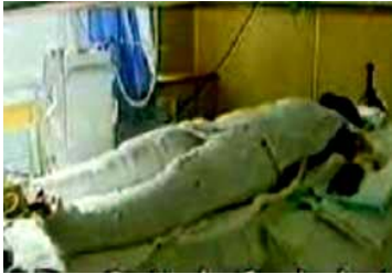
央视《焦点访谈》中的“自焚者”被包裹得严密。

第二天一位法轮功功友听到我丈夫被烧伤前来探望，一看丈夫烧成这样子，痛的直叫，善良的功友不紧不慢的给他讲大法修炼中的一些神奇故事，并告诉他只要他诚心念“法轮大法好、真善忍好”，奇迹也会出现在他的身上。可怎么说丈夫也不相信。