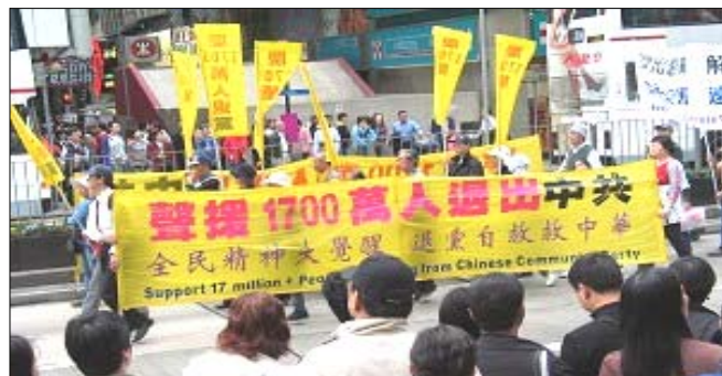
香港游行声援一千七百万中国民众退出中共恶党、团、队

2006 年内，中共中央一些机构的人员持续向退党服务中心发送真名集体退党的声明，甚至中南海内的高层人士，也打电话到海外的退党中心摸底。曾有南方某省一些退党干部，对百名从省级到科级的干部进行了抽样调查，结果是：明确表示可以用化名退党的 41 人；考虑经济利益等原因暂时不退的 32 人；担心退党后被泄密而遭打击报复的 14 人；再看一下时局变化、暂时不退的 13 人；甘心为邪党“奋斗终身”