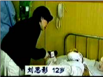
气管切开还能说、唱？记者采访不穿防护服不戴口罩

丈夫念着念着，疼痛逐渐减轻，身上脸上的汗渐渐少了，更奇怪的是满屋子的苍蝇不知道什么时候都