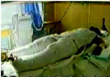
央视《焦点访谈》中的“自焚者”被包裹得严密。

第二天一位法轮功功友听到我丈夫被烧伤前来探望，一看丈夫烧成这样子，痛的直叫，善良的功友不紧不慢的给他讲大法修炼中的一些神奇故事，并告诉他只要他诚心念“法轮大法好、真善忍好”，奇迹也会出现在他的身上。可怎么说丈夫也不相信。