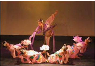
飞天手托花盘、花朵

* 北凉飞天的造型，具粗、重、厚、简的特征，形体较为健硕，颇有朴拙可爱的情趣，当时从西域传来的凹凸法，叠染之法久经岁月的变化，形成一种特别的“小字脸”。