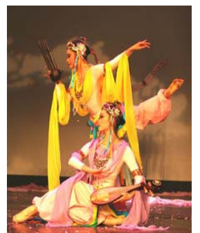
飞天手持各种乐器，演奏、舞蹈

古人云：敦，大也；煌，盛也。敦煌是中华民族文化的骄傲，是古老不衰的东方明珠，婀娜的飞天，静美的佛雕，辉映出中华民族历史的璀璨斑斓。敦煌壁画为人类展现出了一幅幅天象奇观。后人受敦煌壁画的绚