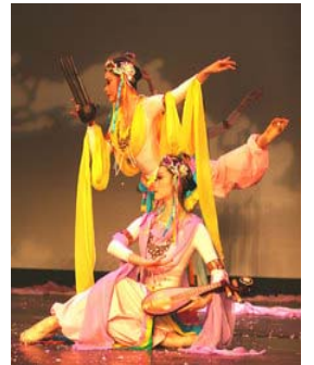
飞天手持各种乐器，演奏、舞蹈

古人云：敦，大也；煌，盛也。敦煌是中华民族文化的骄傲，是古老不衰的东方明珠，婀娜的飞天，静美的佛雕，辉映出中华民族历史的璀璨斑斓。敦煌壁画为人类展现出了一幅幅天象奇观。后人受敦煌壁画的绚