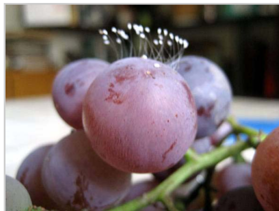
二零零七年七月在中国大陆发现的长在葡萄上的优昙婆罗花

近期，中国大陆各地陆续出现“优昙婆罗花”的盛开，从寺院到寻常百姓家，令人备感佛恩。信神佛者更坚定信念，无神论者也该默然思量。人世间每件大事的发生，都对应着天象，是天象变化的反映。“种瓜得瓜，种豆得豆”，因果报应不论人是否相信，也不管其身份贵贱，都一