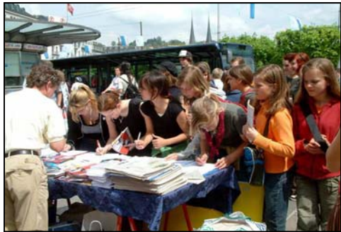
▲一群瑞士学生排队等候签名支持法轮功。

区。一位中国医生修炼了法轮功后，就开始告诉她认识的人，随后人传人，心传心，日内瓦的法轮功学员就越来越多。