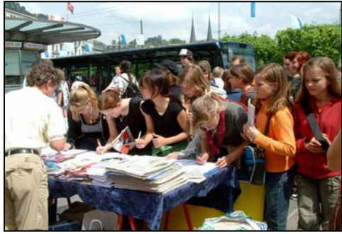
▲一群瑞士学生排队等候签名支持法轮功。

区。一位中国医生修炼了法轮功后，就开始告诉她认识的人，随后人传人，心传心，日内瓦的法轮功学员就越来越多。