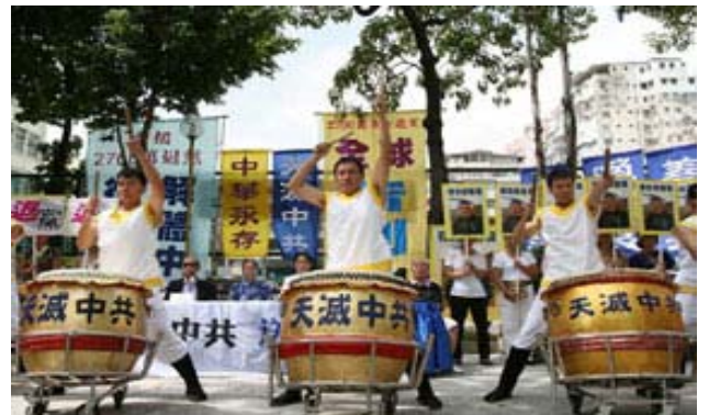
香港声援二千七百万中国勇士退出中共及其附属组织集会开始

【明慧网】二零零七年九月三十日，香港退党服务中心联合香港大纪元等团体机构举行了声援二千七百万勇士退出中国共产党及其相关组织的集会游行。集会邀请了香港民主人士、宗教界人士、中共暴政下的受害者，以及退党服务中心义工出席发言。