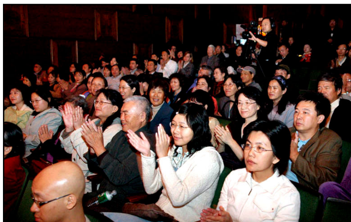
观众盛赞大赛水准高，称“余音绕梁”

此次“全世界华人声乐大赛”以中国传统、民族、经典歌曲，影视插曲和中外歌剧咏叹调，以及艺术歌曲为比赛曲目；是由新唐人电视台主办的国际音乐比赛系列赛事之一。其宗旨是为了促进文化交流，弘扬纯真、纯善、纯美的正统的声乐艺术。此次大赛