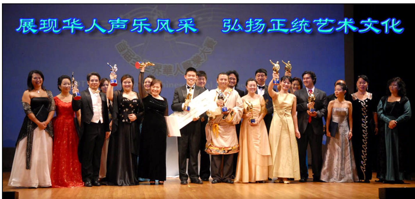
首届全世界华人声乐大赛圆满落幕，赞誉声满堂，对弘扬中华正统文化起到很大作用

【明慧网】受到各界瞩目的“首届全世界华人声乐大赛”，于二零零七年十月十五日上午在美国纽约考夫曼音乐厅拉开序幕，来自台湾、香港、挪威、阿根廷、德国、英国、希腊、荷兰、西班牙、澳洲、阿根廷、加拿大、瑞典、韩国、新加坡、美国等二十多个国家和地区的选手，经过三天的紧张角逐，二十名选手金榜题名，至十七日下午大赛圆满落幕。