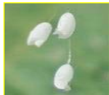
优昙婆罗花放大图

2005 年以来，在韩国的许多佛教寺院中相继发现了一种白色的小花，被不少法师和信徒认为是“优昙婆罗花”开了。而按照佛经的记录，2005 年正是佛家的 3032 年。