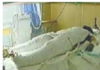
央视《焦点访谈》中 的“自焚者”被包裹 得严密。