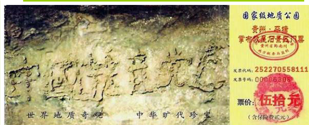
贵州掌布乡风景区门票上的“藏字石”照片，“中国共产党亡”六个大字清晰可见。