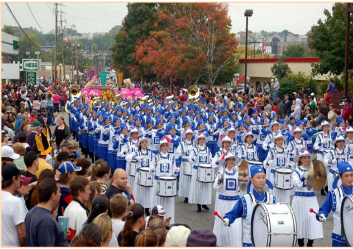
▲身穿传统宫廷乐团服饰的天国乐团受到观众的欢迎