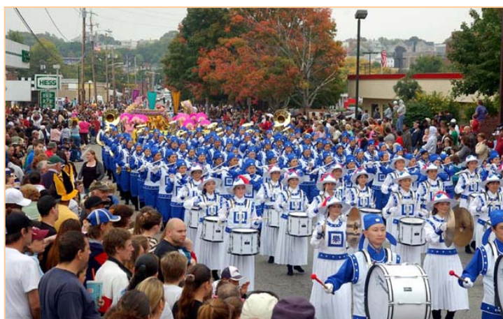
▲身穿传统宫廷乐团服饰的天国乐团受到观众的欢迎