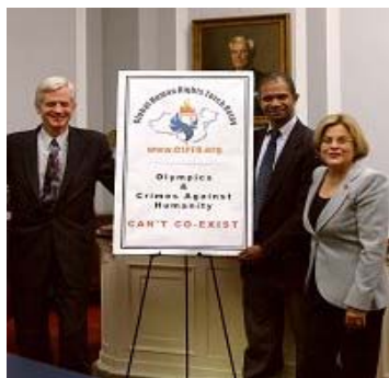
法轮功受迫害真相联合调查团（CIPFG）成员前加拿大外交部亚太司司长大卫·乔高（左）、CIPFG 华府代表基思·威尔（中）与美国国会众议员伊丽安娜·罗斯·雷婷恩在国会瑞本办公大楼举行的新闻发布会现场。

高智晟在信中说，（中共）对“法轮功”已持续了八年的惨烈镇压，是中国乃至全人类最为持续、最为深重的人道主义灾难。与触目惊心的“法轮功”灾