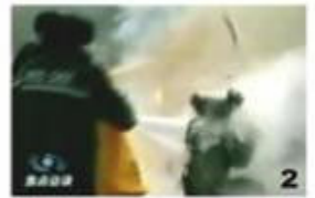
2、击打后飞出的物体