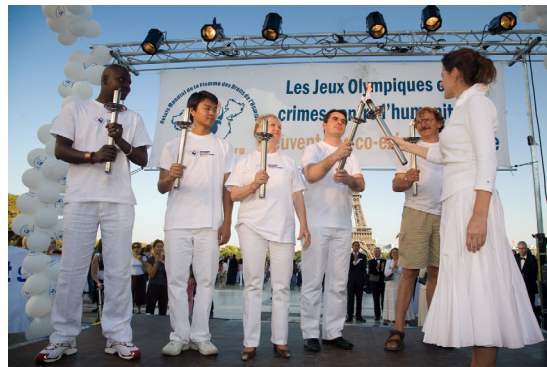
▲巴黎人权广场点燃象征五大洲的五把人权火炬

人权圣火全球传递活动于当地时间9月16日下午4点半，传递到了“人权祖国”法国首都巴黎（“世界人权宣言”在此签订而得名）。法国各界政要、运动员、演艺界、华人社团近千人聚集在人权广场，为人权圣火的到来欢呼鼓掌。现场举行了演讲、音乐会、烛光守夜活动。法国多位政界要员发来贺信表示高度的支持。