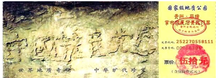
贵州省平塘县掌布乡风景区门票

考察后一致认为，这“藏字石”上未发现任何人工的痕迹，海内外一百多家报纸、电视、网站转发了这消息，“藏字石”的图片还被赫然印在贵州“藏字石”风景区的门票上（下图）。（在网上搜索“藏字石”即可见证！）