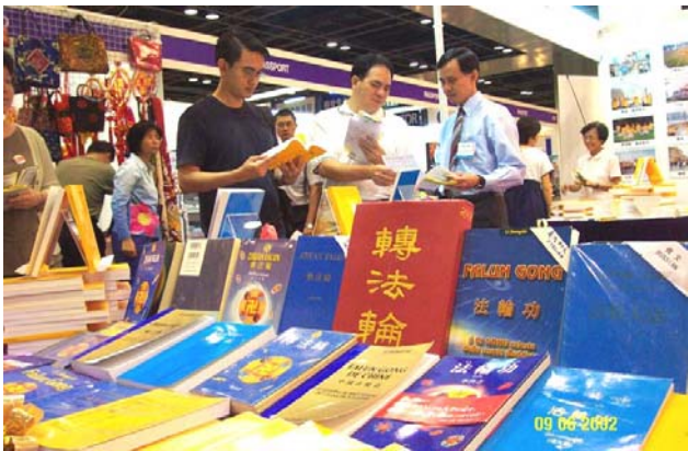
新加坡世界书展中的各语种法轮功书籍。 (2002 年 6 月)

到 2007 年 5 月，法轮大法主要著作《转法轮》已被翻译成 30 种语言并在世界各地出版发行；《法轮功》已被翻译成近 40 种语言并出版发行；法轮大法使各国人民对中国的悠久灿烂文化更加向往，给中国赢得巨大的国际声誉，截止 2006 年底，获得海外各国政府及各界的 2723 项褒奖与支持议案信函（包括美国、加拿大、澳大利亚、台湾、欧洲、新西兰、日本、印度尼西亚、秘鲁和中国 1999 年以前颁发的 24