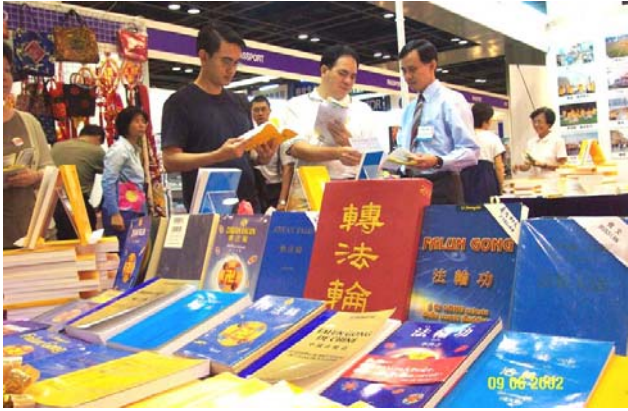
新加坡世界书展中的各语种法轮功书籍。 (2002 年 6 月)

到 2007 年 5 月，法轮大法主要著作《转法轮》已被翻译成 30 种语言并在世界各地出版发行；《法轮功》已被翻译成近 40 种语言并出版发行；法轮大法使各国人民对中国的悠久灿烂文化更加向往，给中国赢得巨大的国际声誉，截止 2006 年底，获得海外各国政府及各界的 2723 项褒奖与支持议案信函（包括美国、加拿大、澳大利亚、台湾、欧洲、新西兰、日本、印度尼西亚、秘鲁和中国 1999 年以前颁发的 24