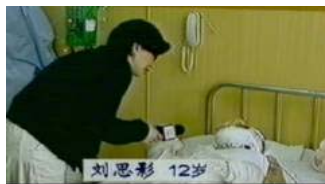
气管切开后还能说话、唱歌？ 记者采访不穿防护服不戴口罩