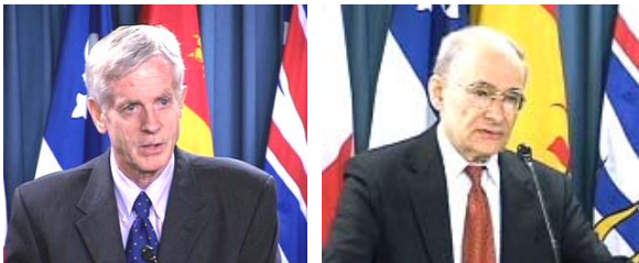
加拿大调查员大卫·乔高 和 大卫·麦塔斯

由加拿大前亚太司司长、资深国会议员大卫·乔高和国际人权律师大卫·麦塔斯组成的独立调查组 2006 年 7 月 6 日向加大媒体公开了“关于调查指控中共摘取法轮功学员器官的报告”。两位调查员经过两个月的调查、取证,通过对 18 类证据的证明和反证,得出结论。“根据我们目前所掌握的情况,我们得出了非常令人遗憾的结