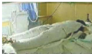
《焦点访谈》中的“自焚者”被包裹得严密