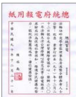
台湾召开法会期间陈水扁总统贺电