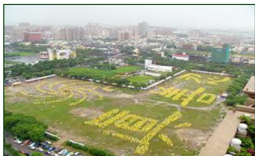
二零零五年庆祝世界法轮大法日，三千名学员雨中炼功排字