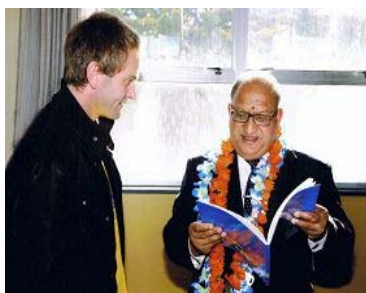
新西兰总督 Anand Saty 翻阅《真善忍国际美术展作品集》

【明慧网】近日，法轮功学员在新西兰的若托鲁阿（Rotorua）举行“大法弟子证实法摄影展”。在展览过程中，办展的法轮功学员见到英国女王派驻新西兰的总督 Anand