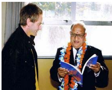
新西兰总督 Anand Saty 翻阅《真善忍国际美术展作品集》

【明慧网】近日，法轮功学员在新西兰的若托鲁阿（Rotorua）举行“大法弟子证实法摄影展”。在展览过程中，办展的法轮功学员见到英国女王派驻新西兰的总督 Anand