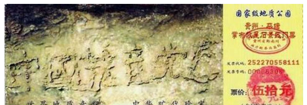
小小门票泄天机—贵州省平塘县李布风景区的门票

二零零二年六月，在贵州省平塘县发现了距今二亿七千万年、天然形成的“藏字石”，巨石断面上“中国共产党亡”六个大字清晰可见。“藏字石”向人们昭示着“神灭中共”的天象。