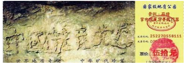
小小门票泄天机—贵州省平塘县李布风景区的门票

二零零二年六月，在贵州省平塘县发现了距今二亿七千万年、天然形成的“藏字石”，巨石断面上“中国共产党亡”六个大字清晰可见。“藏字石”向人们昭示着“神灭中共”的天象。