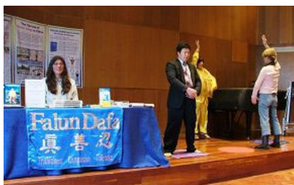
法轮功学员在应邀在英国 剑桥学联活动中演示功法

活动中出现了一个小插曲：一个来自中国的女生来到这个大厅时，看到一群人正在平和地炼功，她被眼前的景象惊呆了：他们炼的不是在中国被禁止的法轮功吗？这还得了，必须立即向上级汇报。于是她找到