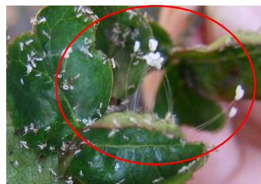
冬瓜山住户家中的婆罗花

请珍惜法轮功学员冒着重重危险传递给您的真相资料吧。有一天您会知道，您此刻的善意流露，为您的未来带去了福泽生机。◇