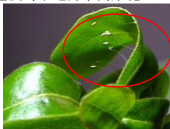
青云小学内的婆罗花