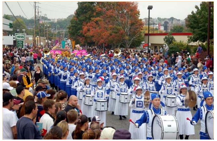
▲身穿传统宫廷乐团服饰的天国乐团受到观众的欢迎

但是《人民日报》的社论不是法律。《宪法》明文规定立法权是属于全国人民代表大会的职权，其它任何机构或者是个人均无立法权力。江泽民和人民日报评论员没有这项权利。声称“法轮功是×教”，是非法的说