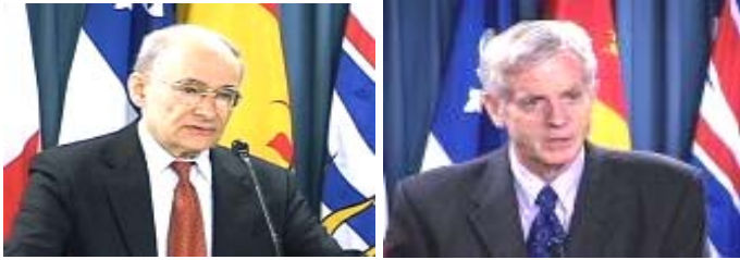
加拿大调查员大卫·乔高 和 大卫·麦塔斯

5月8日，加拿大国会人权委员会前主席、外交部亚太司前司长大卫·乔高（David Kilgour）与著名国际人权律师大卫·麦塔斯（David Matas）举行新闻发布会，宣布在加拿大联合领导对「中共活体摘取法轮功学员器官」的调查工作。他们将该罪行称为“这个地球上从未有过的罪恶”。