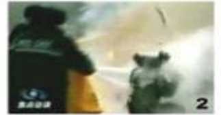
2、击打后飞出的物体