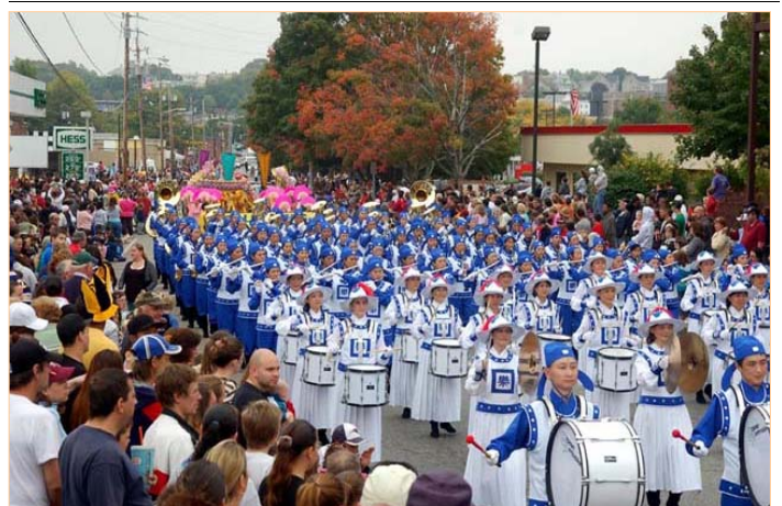
▲身穿传统宫廷乐团服饰的天国乐团受到观众的欢迎