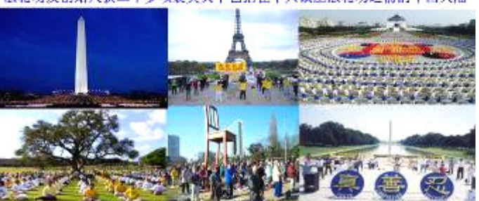
法轮功已传遍亚洲、欧洲、美洲、大洋洲、非洲等八十多个国家和地区