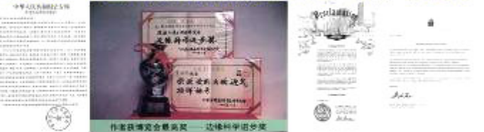
法轮功及创始人获二千多项褒奖其中包括在中共镇压法轮功之前的中国大陆