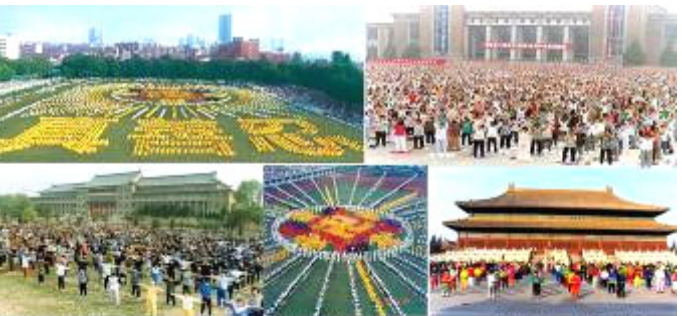
短短的七年时间里，法轮功在中国大陆靠“心传心、人传人”修者逾亿