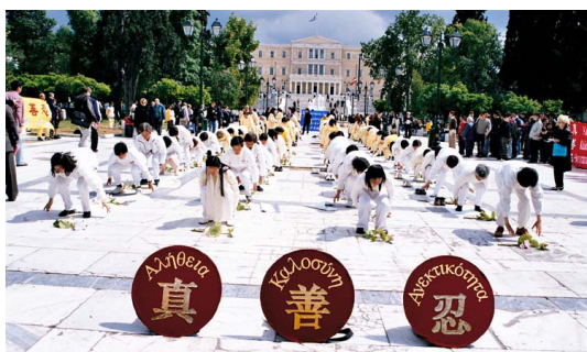
二零零二年海外大法弟子在希腊首都雅典的新达克码的国会大厦广场前集体炼功

【明慧网】二零零七年八月，希腊文《转法轮》正式出版发行，并已在当地书店出售。《转法轮》是法轮大法创始人李洪志先生现今已经出版的三十多本著作中，最主要的著作，也是法轮功学员修炼的主要指导书。迄今为止，《转法轮》已被译为三十多个语种，法轮大法已洪传世界近百个国家。