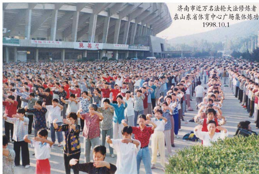
济南市近万名法轮大法修炼者 在山东省体育中心广场集体炼功 1998.10.1