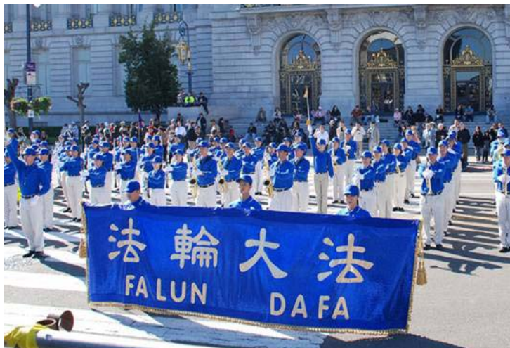
图：天国乐团在游行主席台前演奏