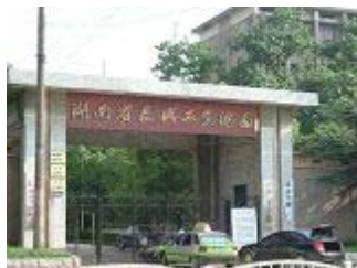
湖南女子监狱位于长沙市湘樟路中段，即“湖南省长兴工业总厂”