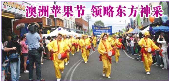
澳洲苹果节 领略东方神采

修炼者的灭绝性迫害，从根本上违背了天意、人心，从而也完全丧失了其自身的存在基础。打击善的必然是恶的，迫害正的必然是邪的。中共在打压法轮功的过程中，将自己的真实邪恶面目暴露无遗。