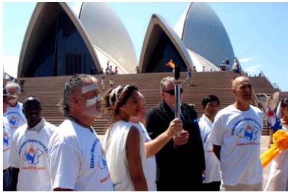
人权圣火经过澳洲悉尼歌剧院

二零零七年十月二十七日，人权圣火于上午十点左右到达澳洲悉尼市，多名澳洲政要、社区和人权团体的代表共同在悉尼市政厅前举行圣火迎