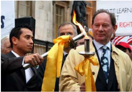
英国伦敦人权圣火传递仪式

【明慧网】人权圣火传递活动是由全球三百多名政要、医生、律师等组成的“法轮功受迫害真相联合调查团”发起，在全球巡回传递，目的是呼吁国际社会关注中国恶劣的人权状况、尤其是中共对法轮功的迫害，拒绝让象征人类和平自由的奥运变成中共实行独裁和镇压的“血腥奥运”。人权圣火于八月九日在希腊点燃，至今已途经十八个国家的二十五个城市。零七年十月二十五日，人权圣火全球传递活动抵达英国伦敦。