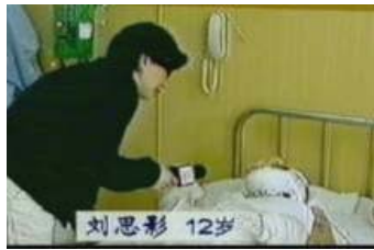
▲ 自焚者刘思影气管 切开还能唱歌？记者采 访不穿防护服，不戴口 罩？

高中时我的成绩很不稳定，平时在班级最好是十四、五名，有时还退到三十几名。进到高三后，虽然我很努力，可成绩依然保持在班级中上游。我爸爸、妈妈都是矿务局下岗职工，他们把全部的希望都寄托在我这个独生女儿身上，所以妈妈很着急，常常领我到在高中教学的舅舅那补课。舅舅每次都会耐心地给我补课，在补课之余还给我们聊一些他修炼法轮功之后身心受益的感受，以及中共是如何利用谎言和暴力来迫害法轮功学员。