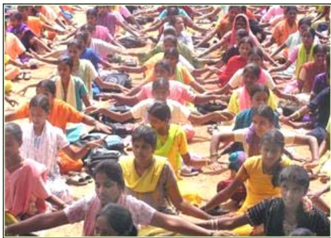
印度一所女子学校的千余名学生正在学炼法轮功。

【明慧网】在印度，现在已有至少三十几所学校的成千上万的师生在修炼法轮功。法轮功为什么在印度学校有这么大吸引力呢？仅来看看下面的一个例子吧：