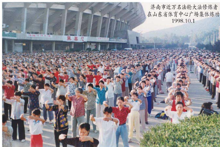
济南市近万名法轮大法修炼者 在山东省体育中心广场集体炼功 1998.10.1