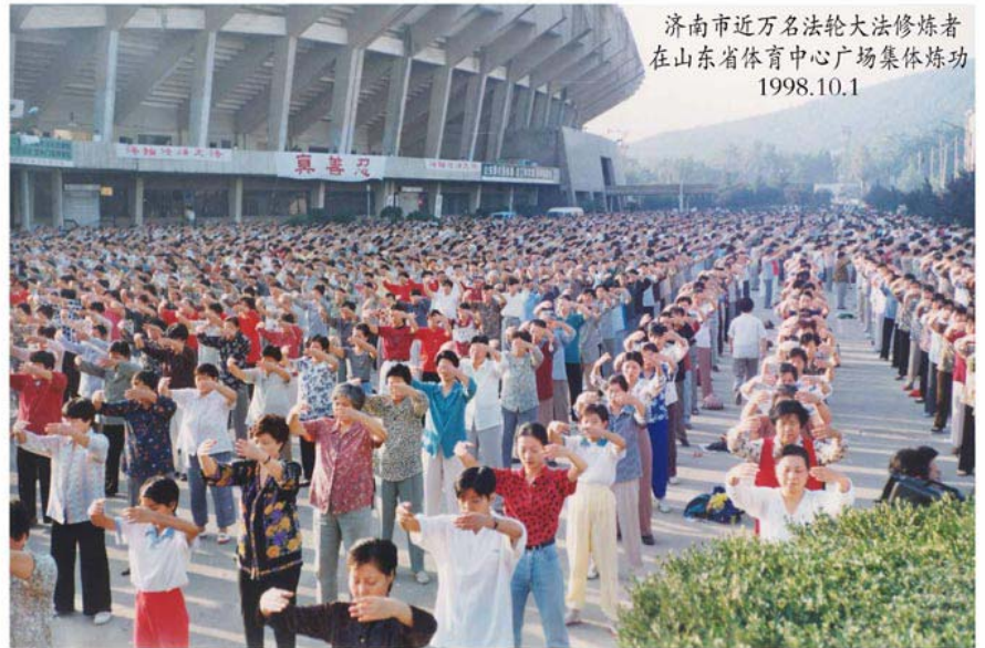
济南市近万名法轮大法修炼者 在山东省体育中心广场集体炼功 1998.10.1