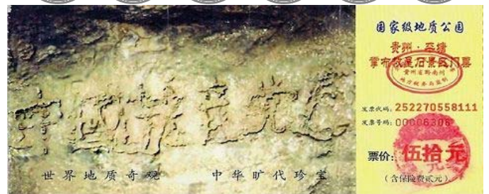
掌布“藏字石”风景区门票

2002年6月在贵州境内平塘县掌布乡桃坡村掌布河谷风景区发现了“藏字石”，此石是从石壁上坠落而下后分为两半，右石裂面清晰可见“中国共产党亡”六个横排大字，字体匀称方整，每字近一尺见方。专家们实地考察后一致认为，“藏字石”上的字位于距今2.7亿年左右。中共恶贯满盈，天要其亡，爱惜自己生命的人，醒悟赶紧退党。◇