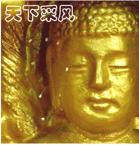
上图:1997 年优昙婆罗花在韩国首次被发现。

中共建政以来，有六千万到八千万人非正常死亡，超过人类两次世界大战死亡人数的总和。接二连三的各种血腥政治运动，镇反、三反、五反、肃反、反右、荒诞的大跃进和相继而来的三年大饥荒、反右倾、四清、文革、“六四”镇压学生、迫害法轮功，等等等等，无数善良人成了中共的虐杀对象。中共杀人太多，罪行滔天，天理不容！