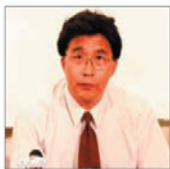
前沈阳市司法局 局长 韩广生