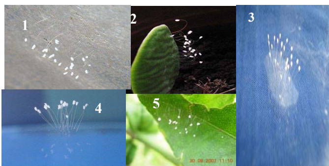
世界各地各处盛开的优昙婆罗花：

八月先后，全国各地盛开了大量的优昙婆罗花，分别在住宅内，玻璃上、纱窗上、塑钢窗户上、植物的叶子上、西红柿上、葡萄上、墙壁上等处，数十朵白色的小花聚集在一起不等。每朵花花冠的直径约有1毫米，花径比头发丝还要细。一般花不可能在没有泥土和养分的地方生长，其花在接受强烈的日照依然盛开不枯萎，故而把该优昙婆罗花称为“奇花”“天花”。