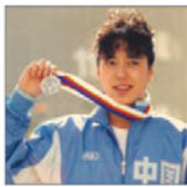
前奥运游泳选手 黄晓敏