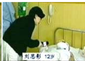
气管切开还能说唱？记者采访不穿防护服不戴口罩。