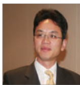
前驻悉尼外交官 陈用林