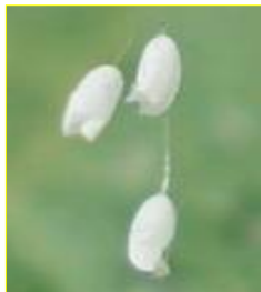
优昙婆罗花放大图

今天的我们正处在新旧交替的时代，人世间的一切都与天象的变化息息相关。“优昙婆罗花”的出现，仿佛在向我们传递着上天的召唤，世人啊，请珍惜机缘，寻找真相，用生命的本性与善念做出正确的选择吧。