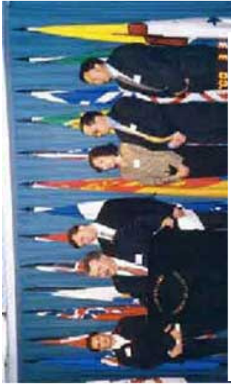
加拿大国会议员和法轮功学员于渥太华国会

八年来，随着法轮大法的广泛传播和中共迫害法轮功真相的持续暴露，世界各国政府、议会、非政府组织及正义律师与善良人民，已经正在给予法轮功学员反迫害行动以巨大的支持和声援。