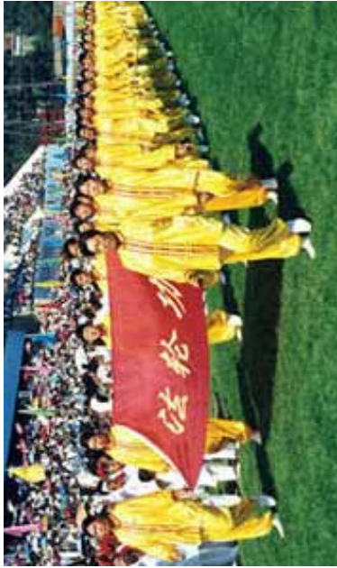
1998年，中国沈阳，法轮功学员在亚洲体育节开幕式上列队入场

正法的洪传导致了邪恶的妒忌。自从江泽民篡夺实权之后，就开始了对法轮功的不断猜忌和攻击。1999年7月20日之后，江泽民开始操控纳粹“盖世太保”式的恐怖机构“610办公室”，系统的对近亿信仰法轮功的学员实行“名誉上搞垮，经济上截断，肉体上消灭”、“打死白打死，打打算自杀”、“不查身源，直接火化”的群体灭绝政策，至今已经持续8年。截至二零零七年十一月九日在明慧网上得到证实迫害致死的人数已达3103人。