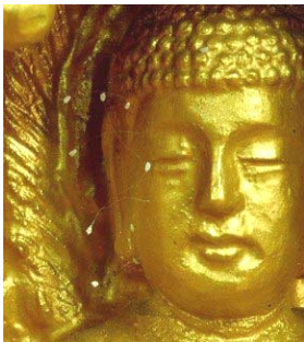
上图：1997 年优昙婆罗花在韩国首次被发现。