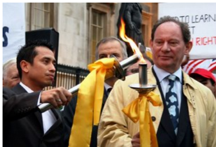
英国伦敦人权圣火传递仪式

【明慧网】人权圣火传递活动是由全球三百多名政要、医生、律师等组成的“法轮功受迫害真相联合调查团”发起，在全球巡回传递，目的是呼吁国际社会关注中国恶劣的人权状况、尤其是中共对法轮功的迫害，拒绝让象征人类和平自由的奥运变成中共实行独裁和镇压的“血腥奥运”。人权圣火于八月九日在希腊点燃，至今已途经十八个国家的二十五个城市。零七年十月二十五日，人权圣火全球传递活动抵达英国伦敦。