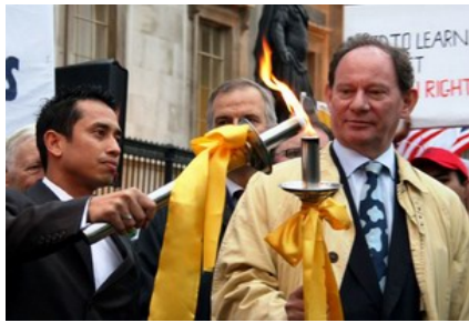
英国伦敦人权圣火传递仪式

【明慧网】人权圣火传递活动是由全球三百多名政要、医生、律师等组成的“法轮功受迫害真相联合调查团”发起，在全球巡回传递，目的是呼吁国际社会关注中国恶劣的人权状况、尤其是中共对法轮功的迫害，拒绝让象征人类和平自由的奥运变成中共实行独裁和镇压的“血腥奥运”。人权圣火于八月九日在希腊点燃，至今已途经十八个国家的二十五个城市。零七年十月二十五日，人权圣火全球传递活动抵达英国伦敦。