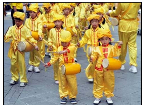
来自明慧学校的娃娃天使

【明慧网】期待已久的「真善忍国际美术巡回展览」，终于在二零零七年十月二十日于台北县永和国父纪念馆隆重开幕了，一幅幅表面祥和的画作，让许多有缘面见的观者震撼，他们料想不到观赏美展也能如此情绪奔腾，思索深入，感触良多。