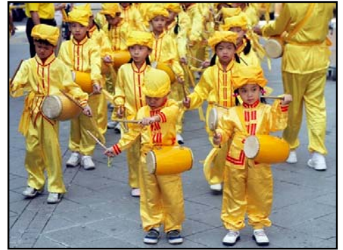
来自明慧学校的娃娃天使

【明慧网】期待已久的「真善忍国际美术巡回展览」，终于在二零零七年十月二十日于台北县永和国父纪念馆隆重开幕了，一幅幅表面祥和的画作，让许多有缘面见的观者震撼，他们料想不到观赏美展也能如此情绪奔腾，思索深入，感触良多。