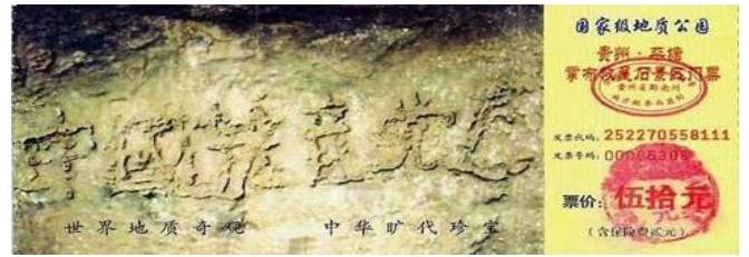
小小门票泄天机—贵州省平塘县拿布风景区的门票