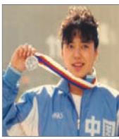
前奥运游泳选手 黄晓敏