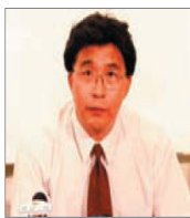
前沈阳市司法局 局长 韩广生