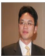
前驻悉尼外交官 陈用林