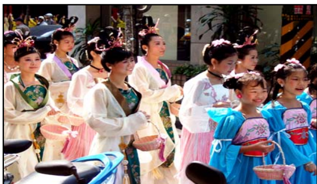
高洁端雅、手提花篮的仙女队伍

只见她们个个手提花篮，笑脸迎人的将手中莲花递送给路边行人，让所有拿到莲花书签的民众都雀跃不已。