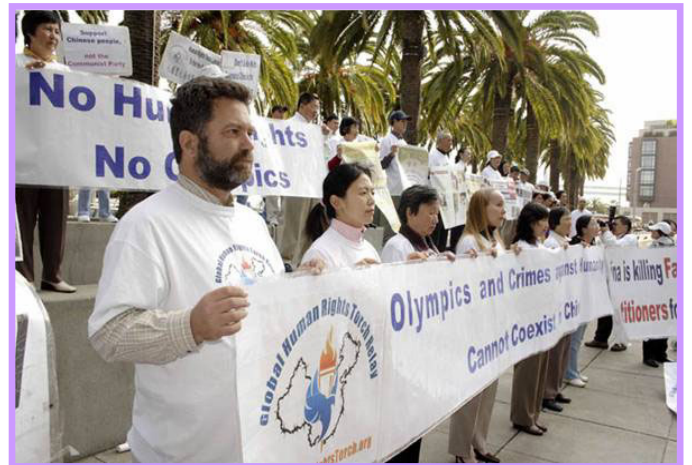
横幅上写着：反人类罪行和奥运会不能共存