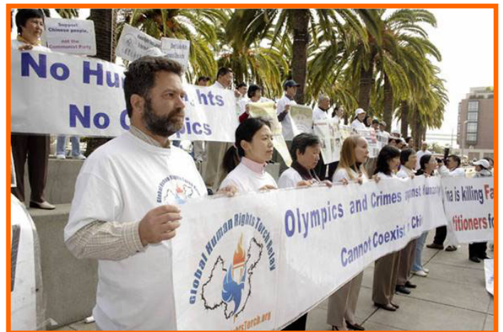
横幅上写着：反人类罪行和奥运会不能共存