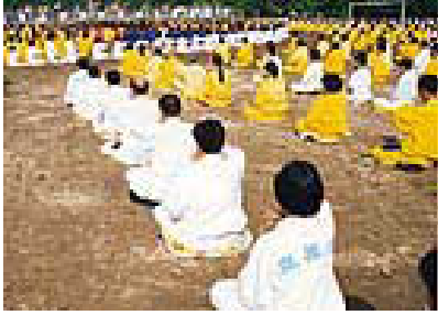
武汉学员在青少年宫集体炼功

这个调查结果充分显示：法轮功修炼使人的心灵得到了净化，思想得到了升华，修炼者都自觉自愿的戒烟、戒酒、戒赌，也避免了由此所