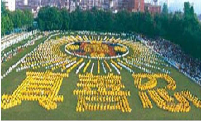
湖北省武汉市，5000 多法轮功学员集体炼功，组成“法轮图形”和“真善忍” ---1997

武汉法轮功学员不约而同的想到要用各种方式把这最美好、最神圣的大法告诉家人、告诉亲戚、告诉朋友、告诉世人。从一九九三年到一九九九年持续不断的助师洪传法轮功，把法轮功的福音传遍了城市、村庄。