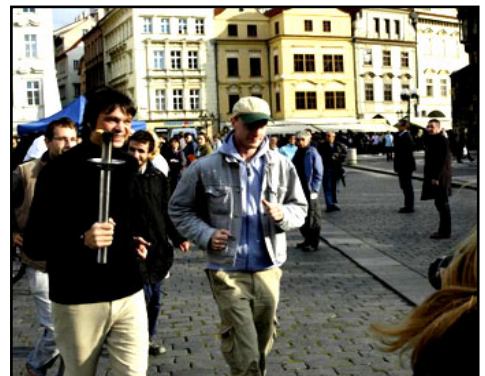
奥运会金牌得主卢卡斯·波勒特带领了人权圣火在布拉格的路跑活动