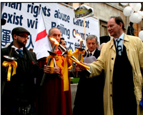
英国伦敦，欧洲议会副主席爱德华·麦克米兰·斯考特点燃圣火