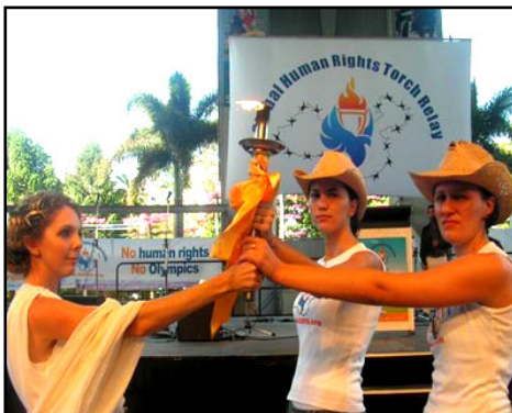
在奥运会的故乡希腊雅典，扮演希腊女神的姑娘点燃人权圣火

目前“人权圣火”在大洋洲的澳大利亚传递。在2008年8月北京奥运开始前，人权圣火将会横跨全球五大洲超过130个城市，最后一站抵达亚洲，中国境内的香港。