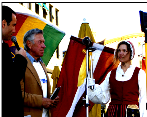
曾两次获得奥运奖牌的佩雷·彼得森将代表哥德堡民众接过人权火炬