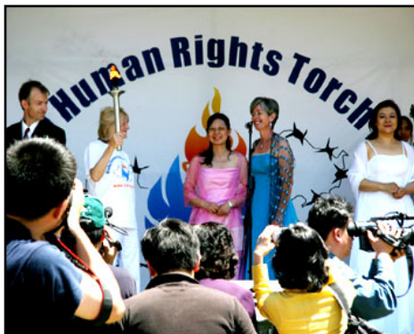
前奥运游泳选手简·比科手拿人权圣火上台演讲，记者争相拍照