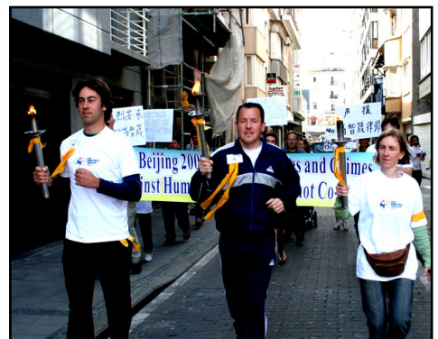
比利时国会议员伍特·德·弗兰德（中）亲自担任圣火传递大使