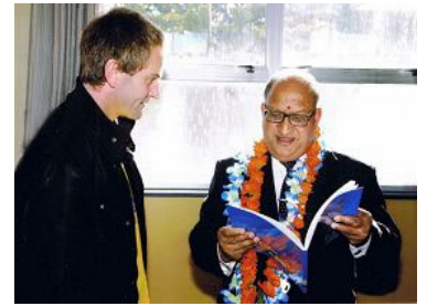
新西兰总督 Anand Saty 翻阅 《真善忍国际美术展作品集》

新西兰的总督 Anand Saty，于是将一本《真善忍国际美术展作品集》赠送给总督，并向他介绍什么是法轮功以及发生在中国的迫害真相。总督认真听了真相后说，他要按惯例将这一礼物存入国会，供国会所有的人阅读、观赏。