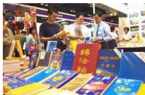
新加坡世界书展中的各语种法轮功书籍。（2002 年 6 月）

到 2007 年 5 月，法轮大法主要著作《转法轮》已被翻译成 30 种语言并在世界各地出版发行；《法轮功》已被翻译成 40 种语言并出版发行；目前世界 80 多个国家和地区有法轮功修炼者；法轮大法使各国人民对中国的悠久灿烂文化更加向往，给中国赢得巨大的国际声誉，截止 2007