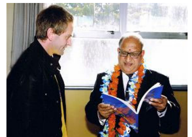
新西兰总督 Anand Saty 翻阅 《真善忍国际美术展作品集》

新西兰的总督 Anand Saty，于是将一本《真善忍国际美术展作品集》赠送给总督，并向他介绍什么是法轮功以及发生在中国的迫害真相。总督认真听了真相后说，他要按惯例将这一礼物存入国会，供国会所有的人阅读、观赏。