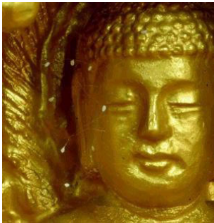
佛像上出现佛家传说中的优昙婆罗花

在佛教经典中，记载了有关“优昙婆罗花”的故事。根据佛经记载，“优昙婆罗花为祥瑞灵异之所感，乃天花，为世间所无，若如来下生、金轮王出现世间，以大福德力故，感得此花出现。”。优昙婆罗花每三千年开花一次，这种花的出现意味着转轮圣王已下世在人间正法，“金轮王出现世间”即解为此。