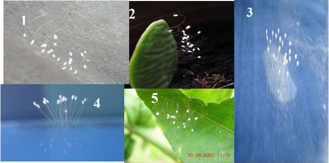
世界各地各处盛开的优昙婆罗花： 1 水泥墙上；2、开在仙人掌上；3、开在毯子上； 4、开在玻璃上；5、开在酸柑叶上

只要我们注意到优昙婆罗花在当世开放的事实，那么我们会惊讶地发现，只差撩开薄薄的一层面纱，世人生生世世期盼着的那个归来者已经呼