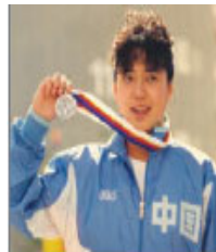
中国前奥运游泳名将黄晓敏

维权律师高智晟于 2005 年 12 月 13 日发表退党声明后, 他表示: “我认为解决中国问题最根本的症结就是抛弃这个邪恶的制度。《九评》提供了一个极好的途径, 传播《九评》促三退是截至目前为止最为有效、最为和平的一个方式。”