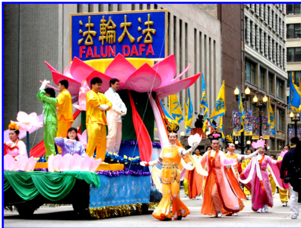
法轮功学员精心制作的莲花花车。（芝加哥）