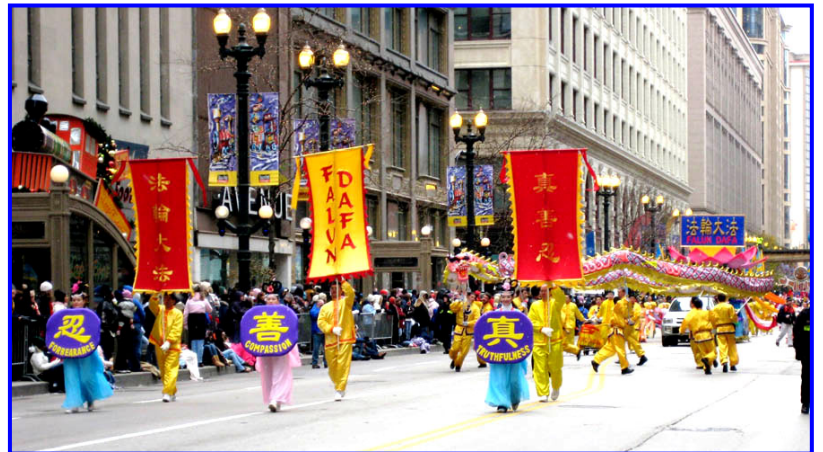
法轮功学员的队伍行进在国家大道上。（芝加哥）