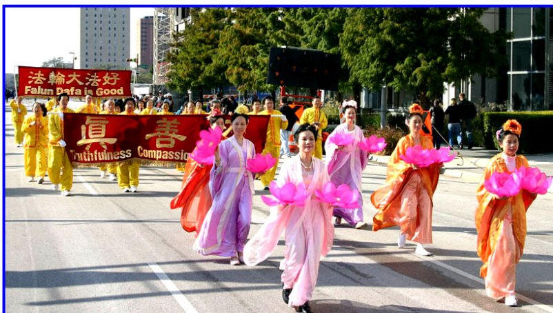
欢乐的“仙女”队。（休士顿）