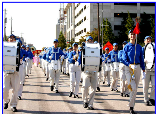
天国乐团神采奕奕、精心的演奏。（休士顿）