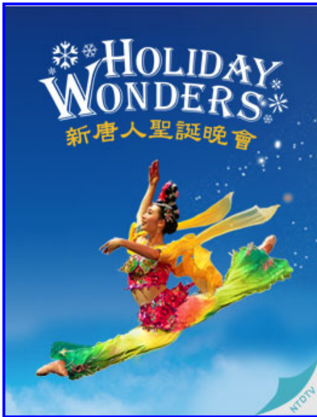
2008 年神韵艺术团全球巡回演出将从 12 月 18 日纽约的圣诞奇观拉开序幕