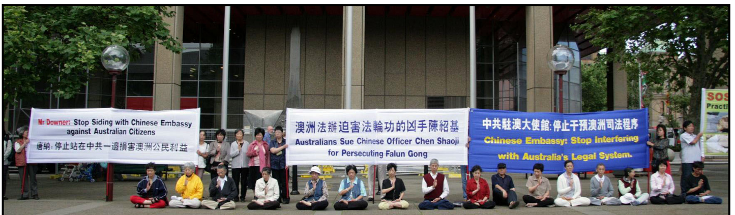
澳洲法轮功学员起诉迫害法轮功凶手陈绍基（广东省副书记、政协主席），中领馆无理干涉，法轮功学员集会抗议。