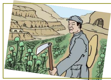
南泥湾“大生产运动”，实际上是非法种鸦片的运动。

当今中共为了迫害法轮功，同样用卑鄙的手段造了很多谣言。随着“天安门自焚”等假案陆续被揭穿，以及《九评》的问世，人们越来越看清了中共的邪恶，觉醒的百姓纷纷顺应天意，退出党、团、队，保平安。在此善劝父老乡亲们：赶快了解真相。特别是那些为眼前名利跟着邪党迫害善良的人，当天灭中共、大难来临时，再说“是共产党让我干的”，就晚了。