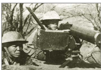
国军将士在台儿庄外围阻击进犯的日军

当时我的家乡属于沦陷区，中共叫“敌后”，八路军的一支部队在那驻扎七年，后来我成了其中的一员。在我入伍前后整整七年间，该部队没打过一次日本人。当时日本人就在城内，八路军在城外。后来，国民党部队一个旅开到当地，准备向日军开战。在国军立足未稳、毫无防备的情况下，突然被我所在的部队团团包围聚歼。激烈的战斗进行了一天一夜，国军的这支抗日部队整整一个旅全被消灭。