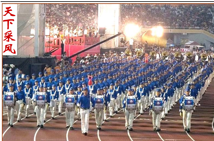
▲十月二十日晚，台灣全運會開幕典禮上，法輪功學員的天國樂團引領各縣市選手進場，贏得熱烈喝彩。