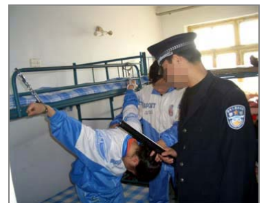
演示图：劳教所酷刑折磨法轮功学员

在郭村乡派出所 九九年“七.二零”以后，我和其他几位同修为法轮功遭迫害去北京上访，被