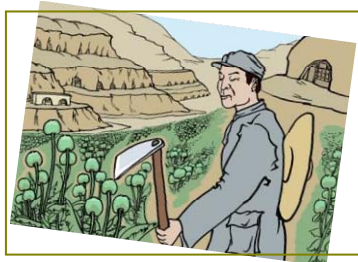
南泥湾“大生产运动”，实际上是非法种鸦片的运动。

当时我在部队的职责就是负责收购、发运毒品。中共夺取政权后立即发动“镇压反革命”，那些当年为中共收大烟的商人（烟贩子）全部被灭口。这些人在被枪决时，连连大呼冤枉：“那是共产党