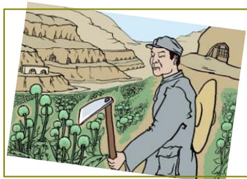
南泥湾“大生产运动”，实际上是非法种鸦片的运动。

当时我在部队的职责就是负责收购、发运毒品。中共夺取政权后立即发动“镇压反革命”，那些当年为中共收大烟的商人（烟贩子）全部被灭口。这些人在被枪决时，连连大呼冤枉：“那是共产党