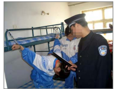
演示图：劳教所酷刑折磨法轮功学员

在郭村乡派出所 九九年“七.二零”以后，我和其他几位同修为法轮功遭迫害去北京上访，被