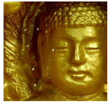
韩国须弥山禅院的佛像 上长出的优昙婆罗花

传说三千年一开的“优昙婆罗花”开花了，它不再仅仅是一个遥远的美丽的传说和梦想，“优昙婆罗花”在当今天世界各地盛开，带给人们惊喜和关注。