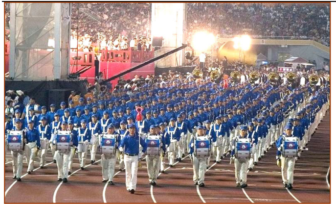
十月二十日晚，台湾全运会开幕典礼上，法轮功学员的天国乐团引领各县市选手进场，赢得热烈喝彩。