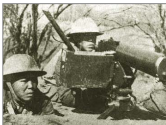
国军将士在台儿庄外围阻击进犯的日军

说共产党“假抗日、真内战”，我深有体会。中共宣称是它领导全国人民打败了日本人。但是，大量