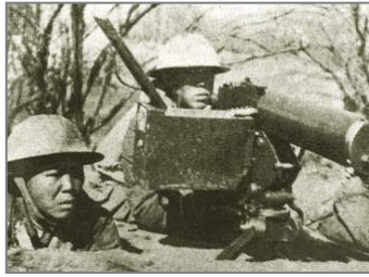
国军将士在台儿庄外围阻击进犯的日军

说共产党“假抗日、真内战”，我深有体会。中共宣称是它领导全国人民打败了日本人。但是，大量