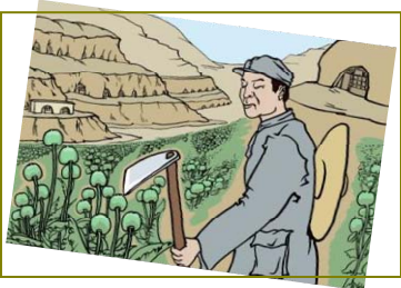
南泥湾“大生产运动”，实际上是非法种鸦片的运动。

当今中共为了迫害法轮功，同样用卑鄙的手段造了很多谣言。随着“天安门自焚”等假案陆续被揭穿，以及《九评共产党》的问世，人们越来越看清了中共的邪恶，觉醒的百姓纷纷顺应天意，退出党、团、队，保平安。在此善劝父老乡亲们：赶快了解真相。特别是那些为眼前名利跟着邪党迫害善良的人，当天灭中共、大难来临时，再说“是共产党让我干的”，就晚了。